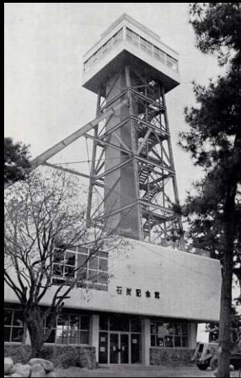
(写真) 開館当時の石炭記念館

1969（昭和44）年11月1日、「日本初の石炭記念館」として誕生した宇部市石炭記念館はまもなく開館50年を迎えます。