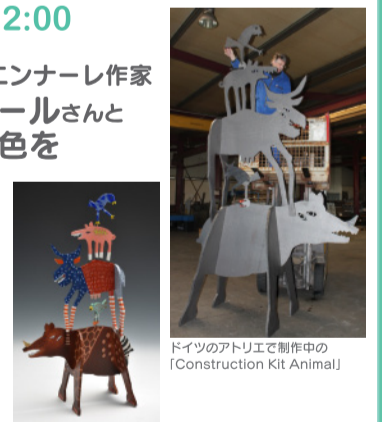
ドイツのアトリエで制作中の「Construction Kit Animal」