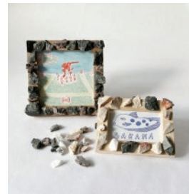
石のかけらモザイク