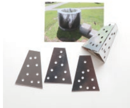
Light of View