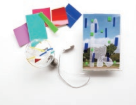
ぺたぺたライト&フレーム

石の彫刻のかけらでフォトフレームを飾ったり、フロッタージュで図鑑を作ったり、 気軽にアートを楽しめる工作キットを販売します。くわしくはWEBサイトをチェックしてね。