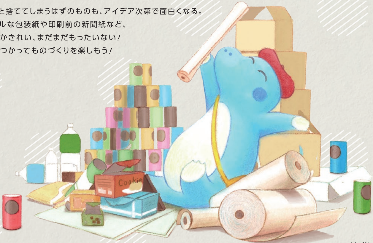
イメージキャラクター トキトキ