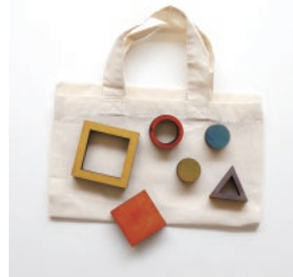
ぺったんこバッグ