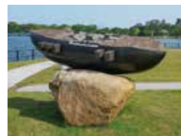
第16回現代日本彫刻展大賞（宇部市賞） 下関市立美術館（植木茂記念）賞 「月に向かって進め」1995 設置場所：ときわ公園

1956年 鳥取県生まれ 1981年 東京造形大学造形学部美術学科 卒業 1992年 兵庫教育大学大学院芸術系美術コース 修了 1995年 第16回現代日本彫刻展・大賞（写真右） 1997年 米子市美術館にて個展・エネルギー美術賞 第17回現代日本彫刻展・神奈川県立近代美術館賞 1998年 第15回神戸須磨離宮公園現代彫刻展・京都国立近代美術館賞・三重県立美術館賞 2000年 現代彫刻センターにて個展・中原悋二郎優秀賞 2003年 文化庁在外研修員として渡米（ハーバード大学） 2008年 東京造形大学教授 就任 2016年 大村智賞大賞（山梨県） 2022年 東京造形大学教授 退任