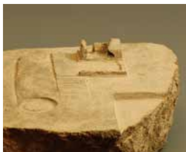
【左】沈黙の淵(1996) / 【中・上】時をわたる橋(2005) 【中・下】ドローイング no.1 (1996) / 【右】イサカ(2004)