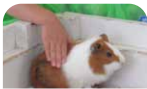
小動物とのふれあい