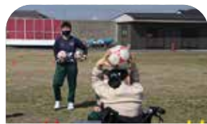
ミネルバ宇部ボール遊び *