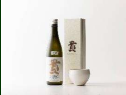
株式会社 永山本家酒造場