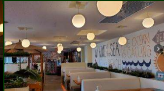
Hawaiian Resort Cafe Leola