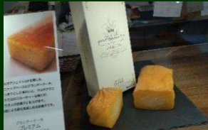
創作菓子のロイヤル