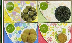
株式会社 山口茶業