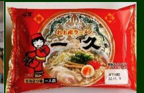
株式会社 一久食品