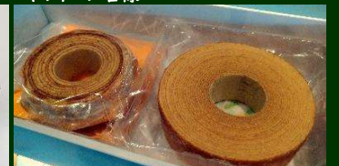
バウムクーヘン&ラ・クチーナ