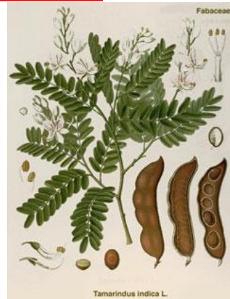
Kiriya chemical online

果実や木の葉、花、昆虫などさまざまなものを食べますが、なかでも「タマリンド」という植物が大好きで、実も葉もとてもよく食べています。