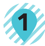
1 渡辺祐策翁像 朝倉文夫 ASAKURA Fumio