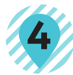
4 道標・鳩 柳原義達 YANAGIHARA Yoshitatsu