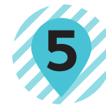
5 リンゴをもつ少年 舟越保武 FUNAKOSHI Yasutake