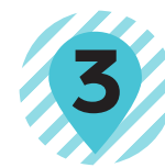
3 冬の子供 佐藤忠良 SATO Tyuryo