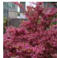
ベニバナ トキワマンサク (見頃 4月頃) 枝がピンク色に染まって見えるほど花が咲きます。