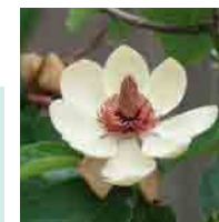
ウケザキ オオヤマレンゲ (見頃 5月頃) 爽やかで甘い香り!