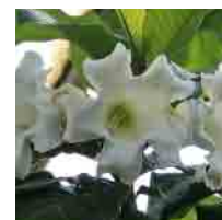
オオバナカズラ (見頃 3月頃) ラッパ状の大きくて白い花を咲かせます。