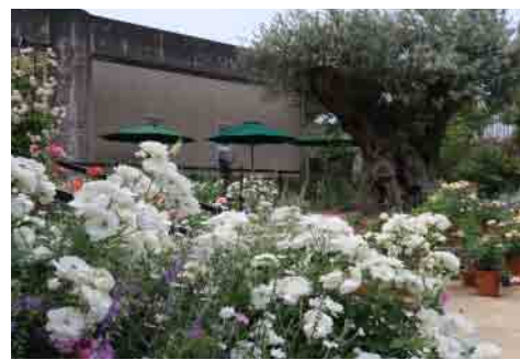
ヨーロッパゾーン 5月頃の様子 春のヨーロッパゾーンは花盛り!