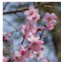
アーモンド(花と実) (見頃 3月～)