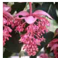
メディニラ マグニフィカ (見頃 4月～5月頃) ピンク色の苞(ほう)からブドウのようなたくさんのつぼみがつきます。