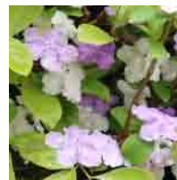
ニオイバンマツリ (見頃 3～4月頃)