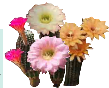
花サボテン (見頃 5月頃)

交配によって大きく改良された特別な花が見れるのはここだけ!花が咲くのは2日程度と短いので開花を見逃さないでくださいね!